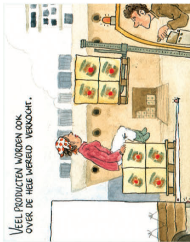
Veel producten worden ook over de hele wereld verkocht.