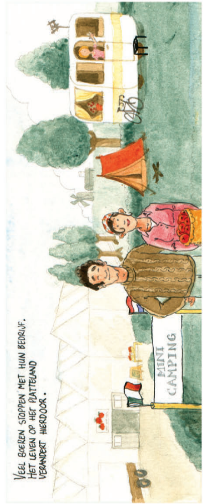
Veel boeren stoppen met hun bedrijf. Het leven op het platteland verandert hierdoor.