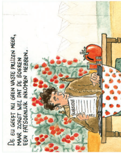
De EU geeft nu geen vaste prijzen meer, maar zorgt wel dat de boeren een fatsoenlijk inkomen hebben.