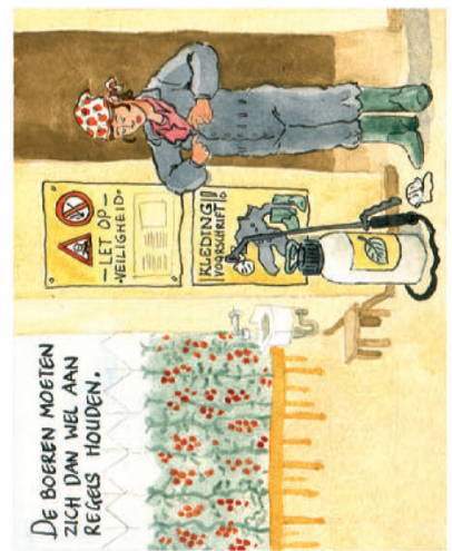
De boeren moeten zich dan wel aan reges houden.