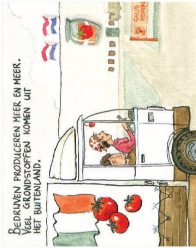
Bedrijven produceren meer en meer. Veel grondstoffen komen uit het buitenland.