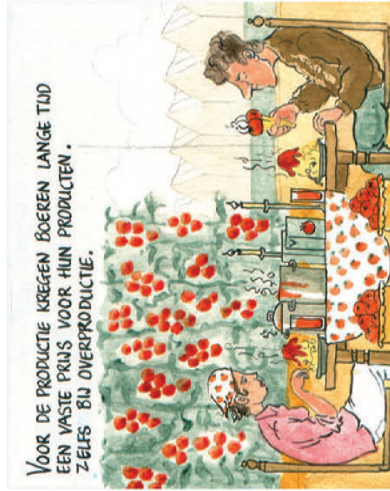
Voor de productie kregen boeren lange tijd een vaste prijs voor hun producten. Zeels bij overproductie.