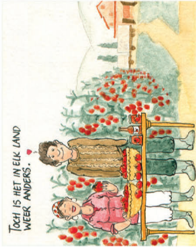
Toch is het in elk land weer anders.