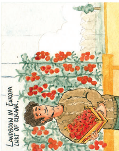
Landbouw in Europa lijkt op elkaar.